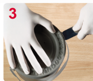
3 AL ABRIR, EVITE DAÑAR LA TAPA