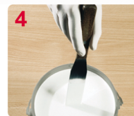
4 MEZCLE BIEN EL CONTENIDO