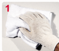
1 LIMPIE LA SUPERFICIE A PINTAR

Se puede aplicar a pincel, rodillo o soplete airless. Se recomiendan entre 2 y 3 manos, según el grado de protección deseada.