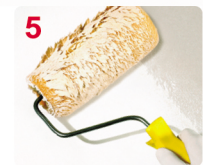
5 PINTE ARRIBA / ABAJO