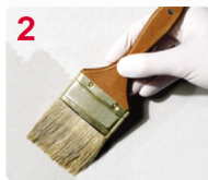
2 APLIQUE SELLADOR FIJADOR