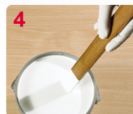
4 MEZCLE BIEN EL CONTENIDO