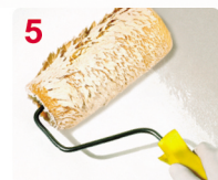
5 PINTE ARRIBA / ABAJO